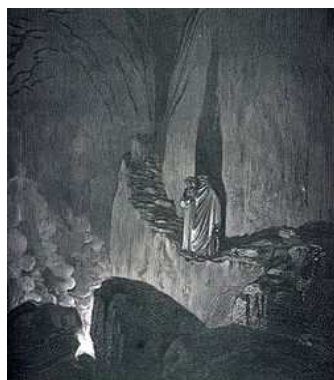
Virgilio mostra a Dante le fiammelle della bolgia, illustrazione di Paul Gustave Doré

presso il Laboratorio di Scrittura e di Lettura - Porto d'Ascoli - Via Toti 49/A